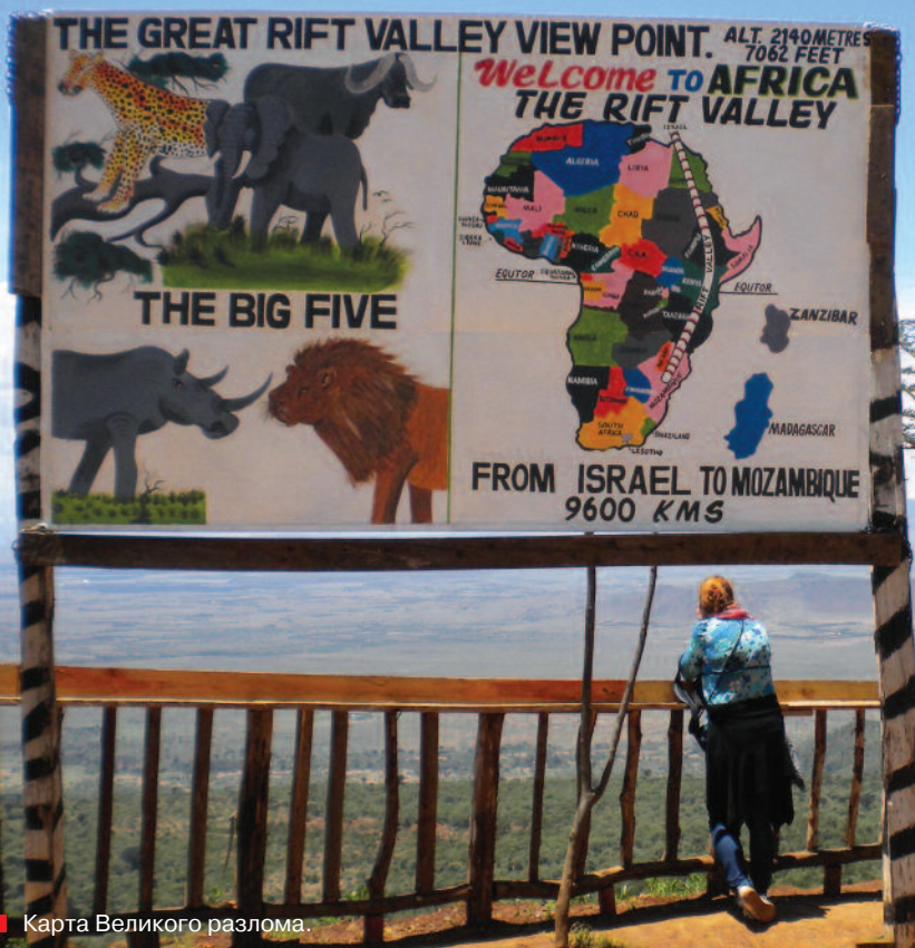
■ Карта Великого разлома.

горы Килиманджаро на протяжении 300 лет. По сути масаи – кочевники и презирают всех, кто ведёт оседлый образ жизни. Они не знают земледелия или ремёсел, зато уверены, что Верховный бог Энгай – муж богини Луны – даровал им всех животных на свете.