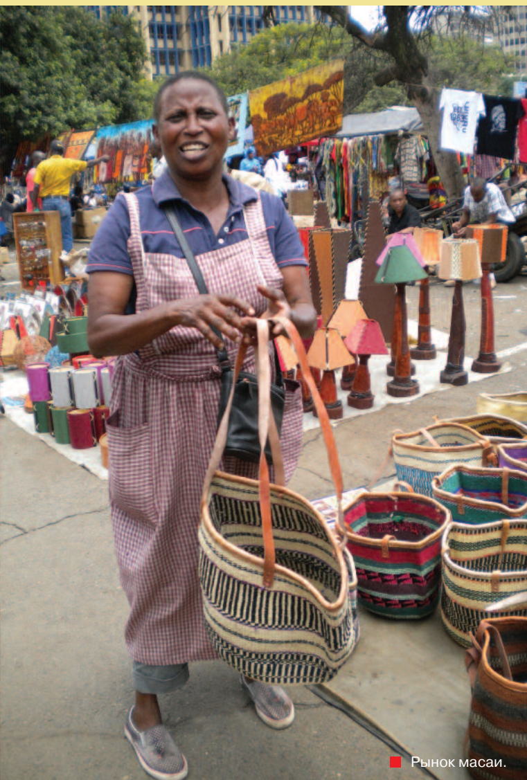
■ Рынок масаи.

веко-обезьян в современного homo sapiens, вызывает сейчас большой интерес и у местной публики, и у иностранцев. В музее проходят также выставки современного кенийского искусства.