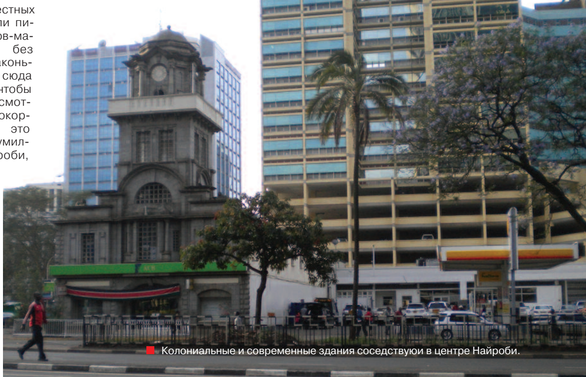
■ Колониальные и современные здания соседствуют в центре Найроби.

Интересными для местных жителей и туристов стали питомники жирафов и слонов-малышей, оставшихся без родителей по вине браконьеров. Учителя приводят сюда детей целыми классами, чтобы они смогли не только посмотреть, но и погладить, покормить животных. Всё это доступно жителям полумиллионной столицы – Найроби, которую, как почти любой мегаполис, можно назвать городом контрастов. Высотные здания банков и офисов в центре резко контрастируют с трущобами Матары, где жизнь кипит, несмотря на нищету и отвратительную антисанитарию.